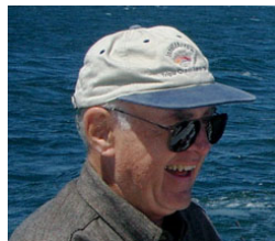
Abbildung: Gordon E. Moore